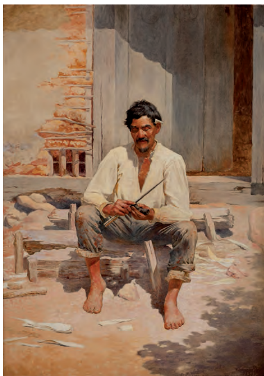
"Caipira picando fumo", de Almeida Júnior, de 1893

A filha havia me telefonado dizendo que o pai estava com câncer, não havia mais nada a se fazer, que todos estavam preparados, mas ele não sabia de nada e desejavam meu silêncio quanto à verdade. Nem precisei de prontuário para saber de quem se tratava, cuidei desse homem durante trinta anos, sujeito de simplicidade e honestidade próprias dos caboclos desta terra, portador de uma doença valvular.