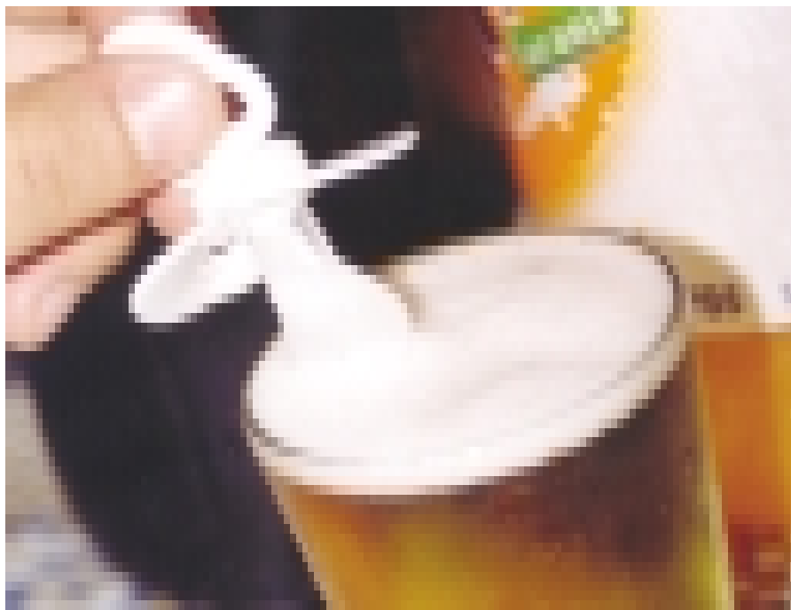
Bebidas: os filhos contam com a tolerância dos pais

Da mesma forma que alguns adultos que consomem bebidas alcoólicas de forma ocasional têm dificuldades em reconhecer que o álcool possa vir a ser uma substância nociva e perigosa, também os jovens que experimentam ou usam drogas ilícitas tem dificuldade em reconhecer que este uso pode vir a se tornar problemático. Isto se deve em grande parte ao fato de que a maioria dos consumidores de drogas, lícitas ou