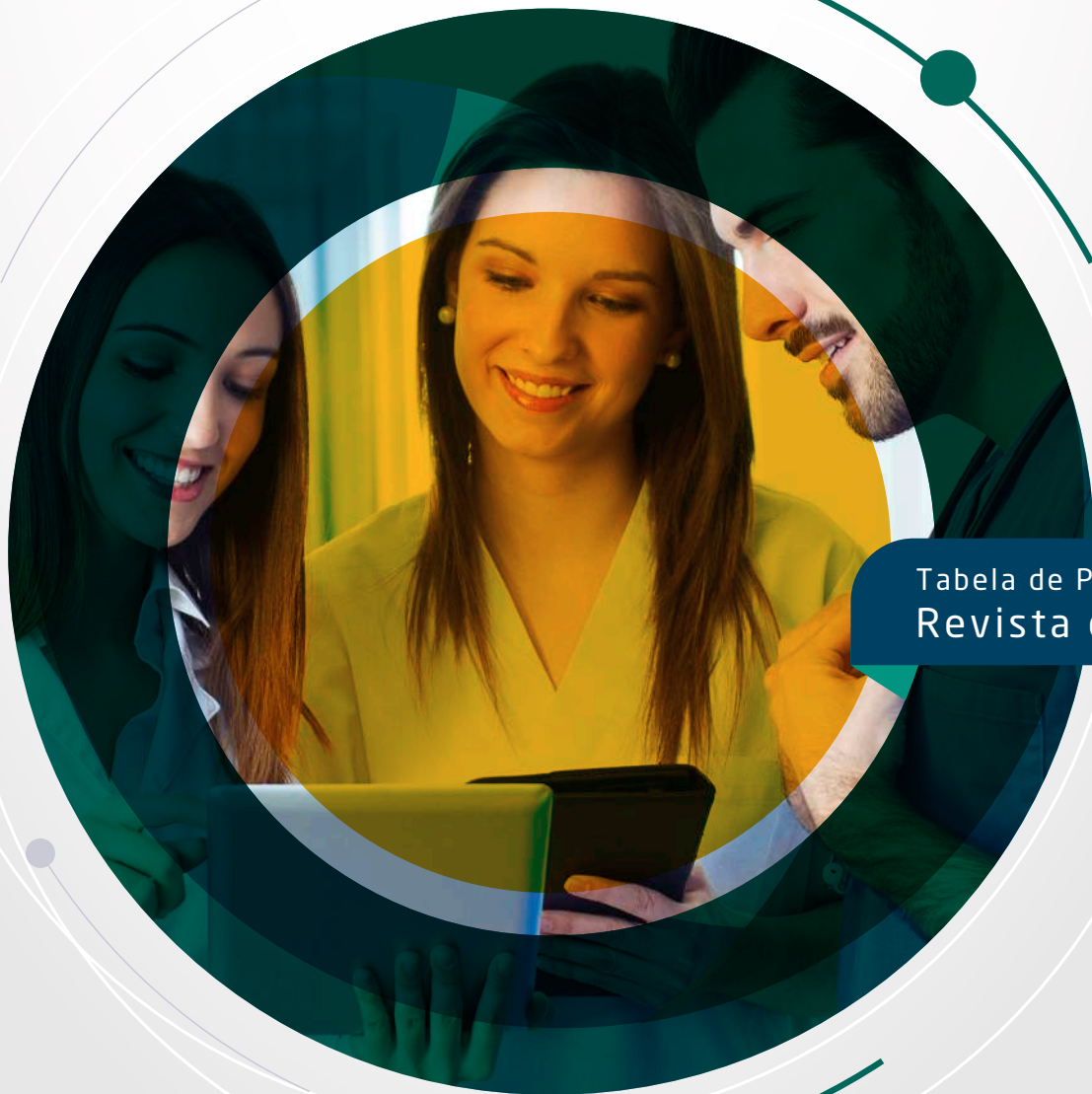
Tabela de Publicidade Revista da APM